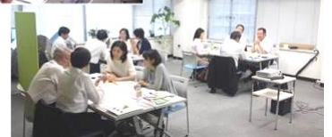
セミナー・ワークショップ