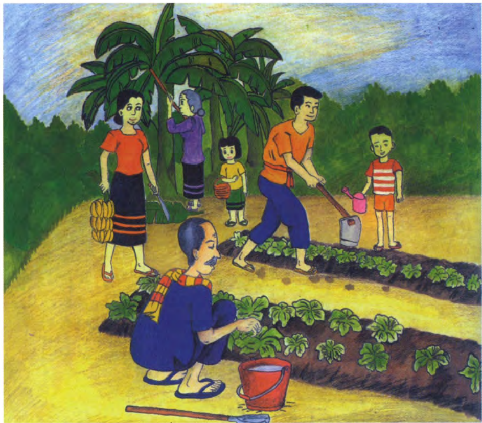
Lukisan: Sasikarn Hantrikanon Sekolah Santa Cruz, Bangkok, Thailand