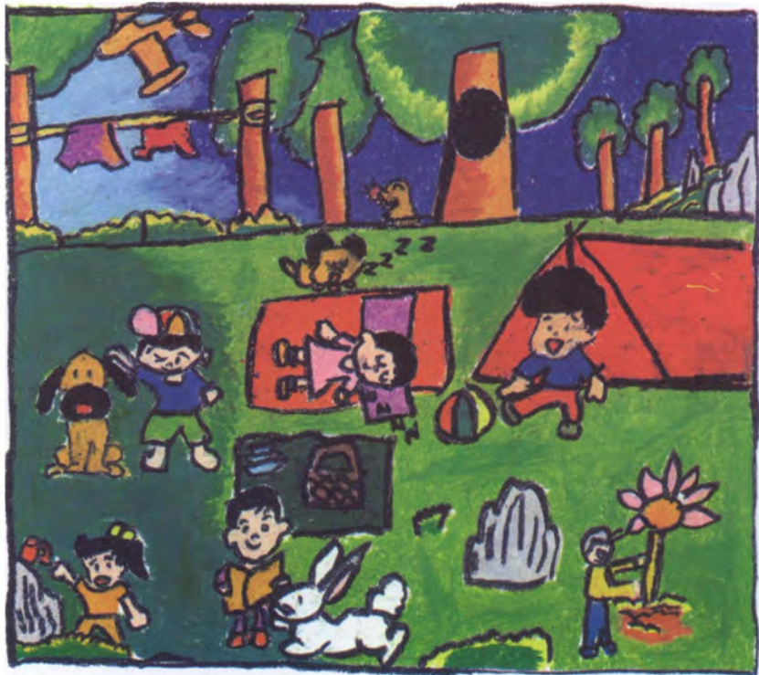
Lukisan: Chainuvat Kitporka Sekolah Rendah Assumption, Bangkok, Thailand