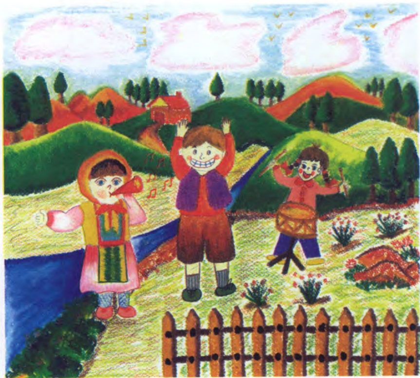
Lukisan: Preeyaporn Asavapinyokit Sekolah Convent Sacred Heart, Bangkok, Thailand