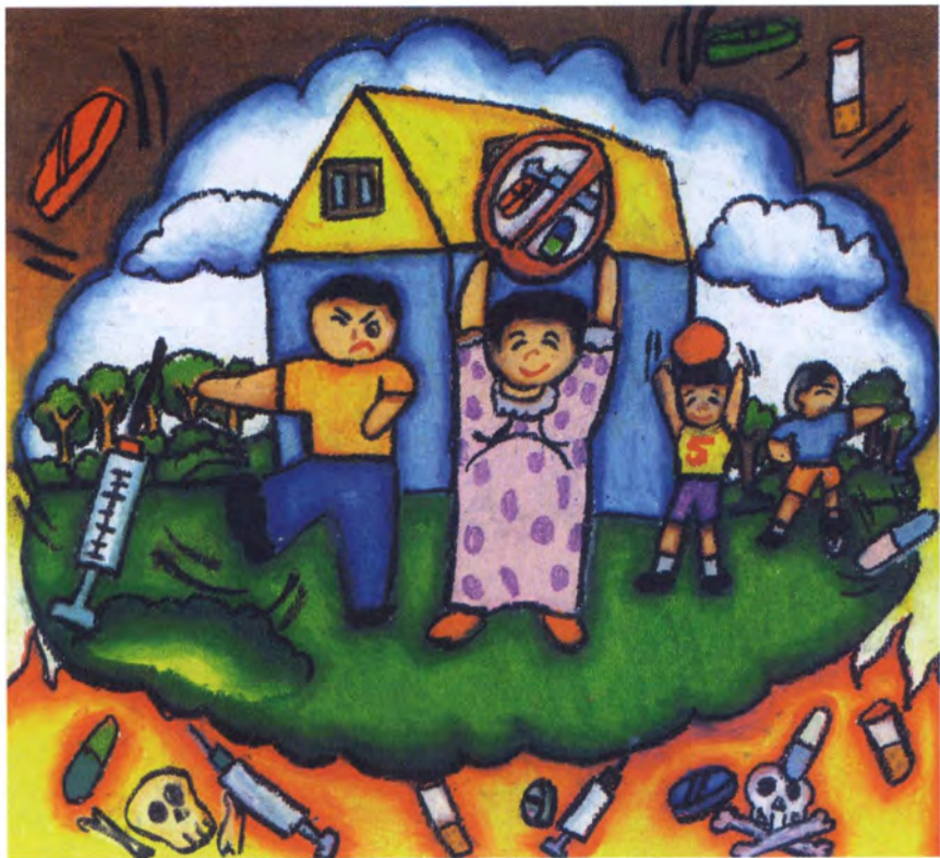
Lukisan : Kawin Daengki Sekolah Rendah Assumption, Bangkok, Thailand