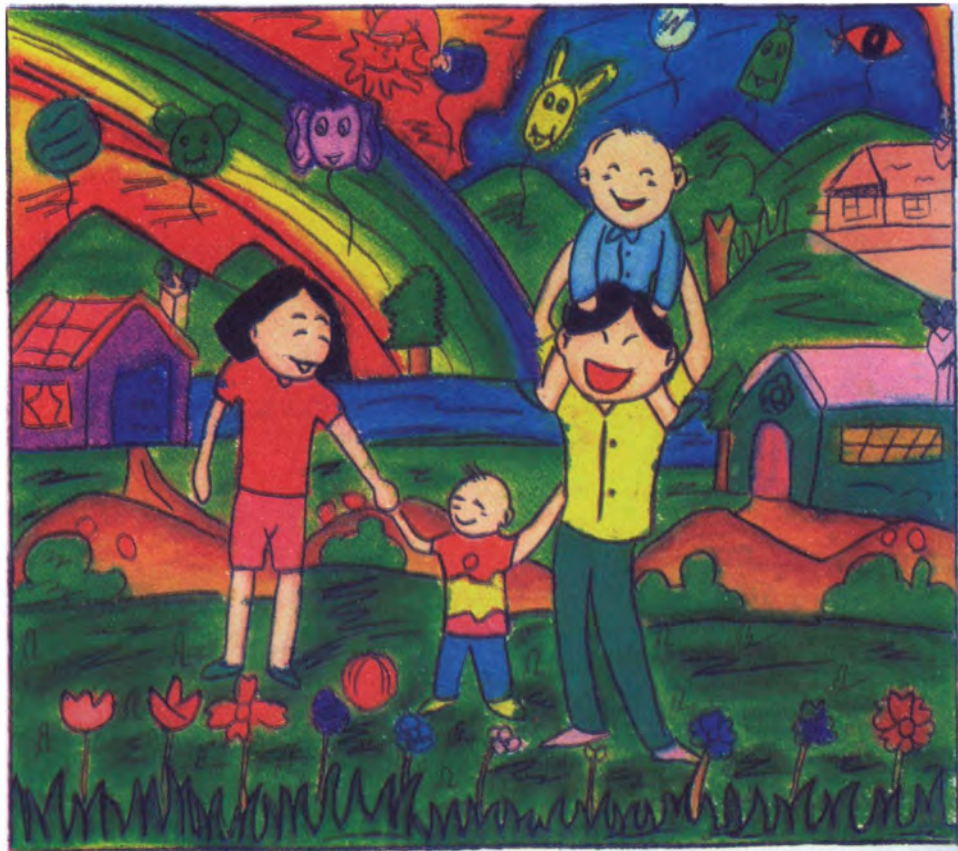
Drawing: Vanicha Ngamsaeng Mariviththaya School, Srisaked Province, Thailand