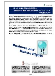
指導原則 ダイジェスト版