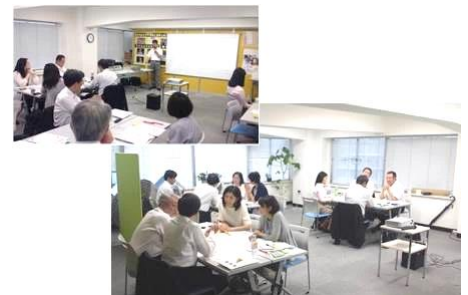
セミナー・ワークショップ